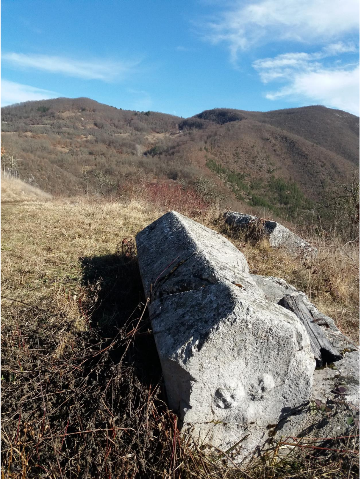
Споменик са натписом